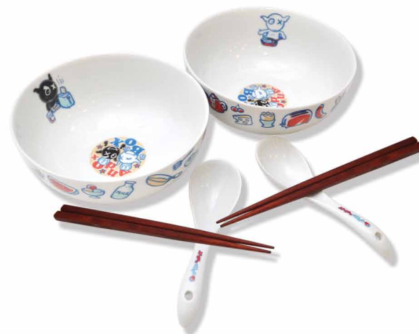
Andox與黑仔2人餐具套裝 HKD150 (湯碗連筷子及湯匙)