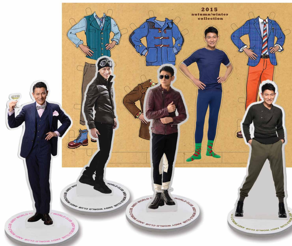
迷你紙牌公仔及公仔紙套裝 HKD100