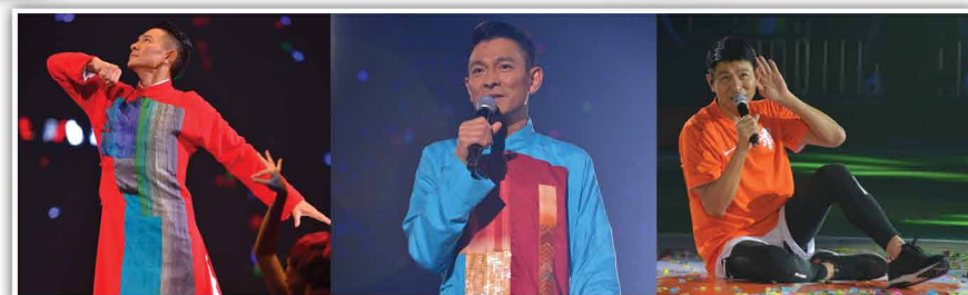
9 吋Andy World Cup Bear HKD150