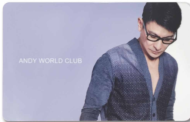
2015 membership card